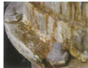
SS400製FG・一般錆止め仕様の臭突管の腐食例

※上表は一般工業用塩ビ板の参考値であり、保証を意味するものではありませんので、ご使用に際しては、十分調査・ご確認して頂きますようお願いいたします。