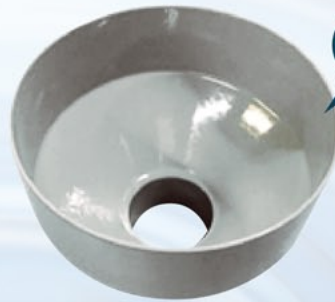
リューコートホッパー